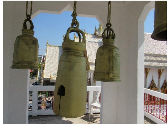
โพงทองสำริดบนหระซัง