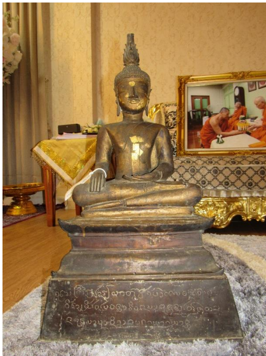
พระพุทธรูปปางมารวิชัย (ศิลาจารึกหลักที่ ๕)