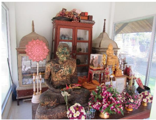
รูปหล่อและพัทธศของพระครูนวกรรมโกวิท