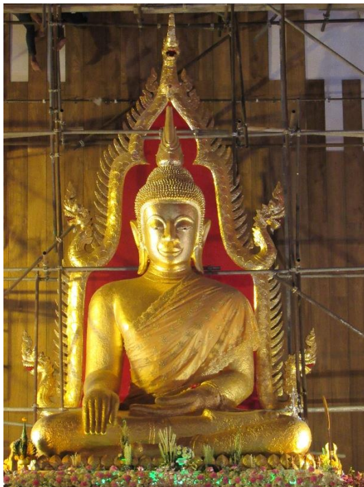
พระเจ้าใหญ่อินทร์แปลง