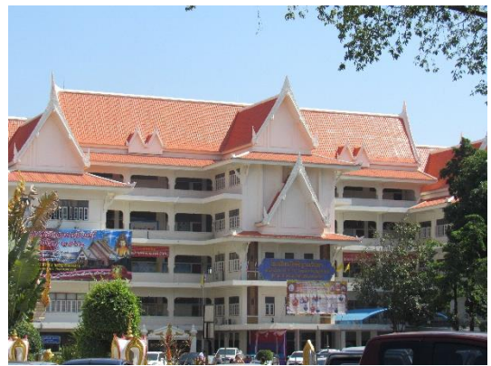
โรงเรียนกิตติญาณวิทยา