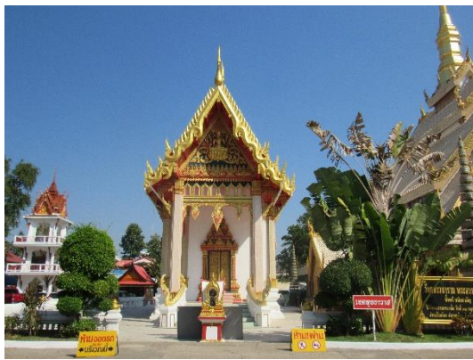
พระอุโบสถ