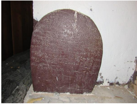
จารึกวัดป่าใหญ่ (ศิลาจารึกหลักที่ ๒)