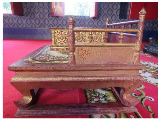
ธรรมาสน์ตั้งสำหรับสวดพระปาติโมกข์