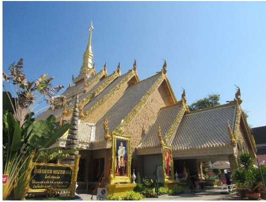
พระวิหารพระเจ้าใหญ่อินทร์แปลง