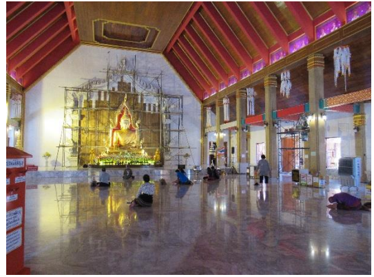
ภายในพระวิหารพระเจ้าใหญ่อินทร์แปลง