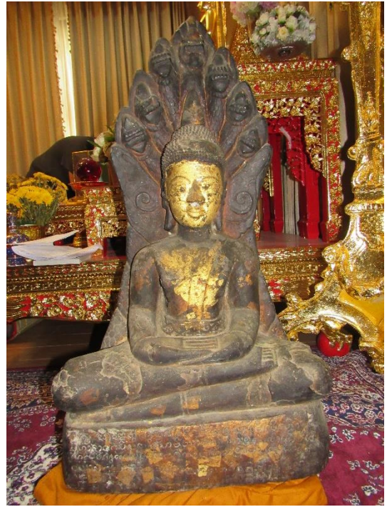
พระศิลาบุจรินทร์ (ศิลาจารึกหลักที่ ๔)