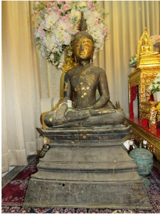
พระพุทธรูปปางมารวิชัย พระประธานลิมหลังเก่า (ศิลาจารึกหลักที่ ๓)