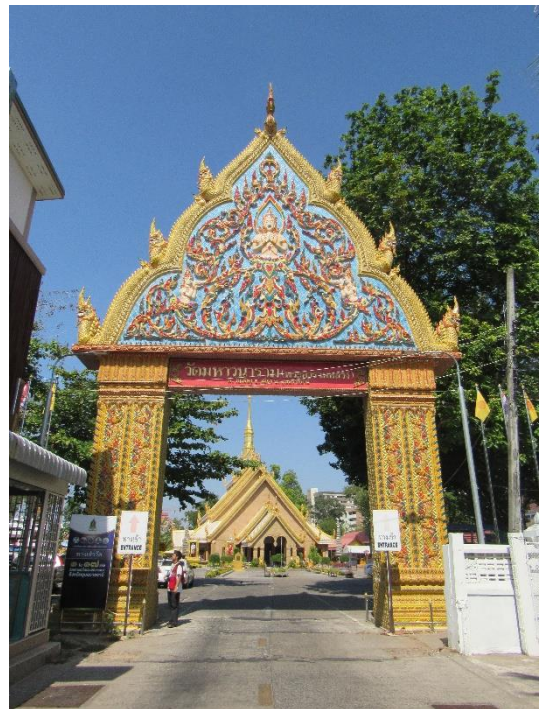
ประตูโขงด้านทิศใต้