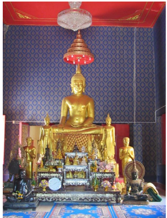
พระประธานในพระอุโบสถ